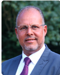
Conference co-chairman CRM Group, Liège, Belgium