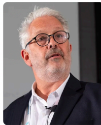
Conference co-chairman CS MINES, Denver, USA