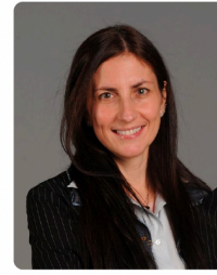
Committee member UNIBS, Brescia, Italy