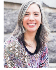
Conference coordinator REGAL, ULAVAL, Canada