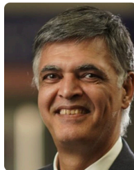
Committee member REGAL, ULAVAL, Canada