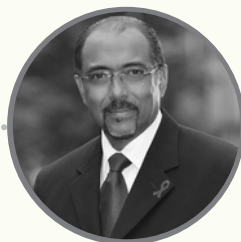
MICHEL SIDIBÉ SPÉCIALISTE DE L'UA POUR LA CRÉATION DE L'AGENCE AFRICAINNE DU MÉDICAMENT (AMA)