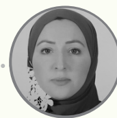
PR. MAJDA SEBBANI PROFESSEUR ÉPIDÉMIOLOGIE - SANTÉ PUBLIQUE