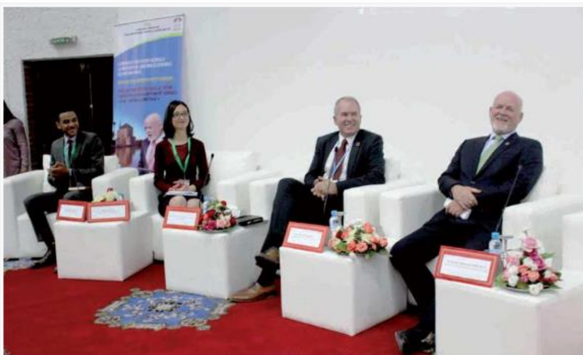
La conférence fait partie des actions tracées par le diplomate fidjien depuis son élection le 13 juin dernier.

Le président de l'Assemblée générale des Nations unies, Peter Thomson, était l'invité de l'Université Cadi Ayyad de Marrakech où il a donné, le 17 novembre, une conférence sur le thème «Objectifs du développement durable et de l'action climatique».