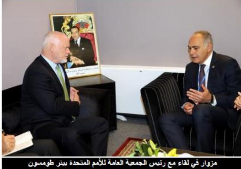
مزور في لقاء مع رئيس الجمعية العامة للأمم المتحدة بيتر طومسون