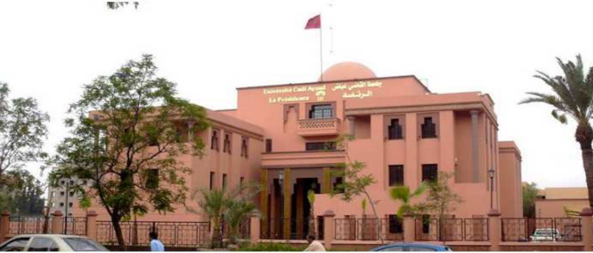
جامعة القاضي عياض تحقق مركز الصدارة بين جامعات المنطقة