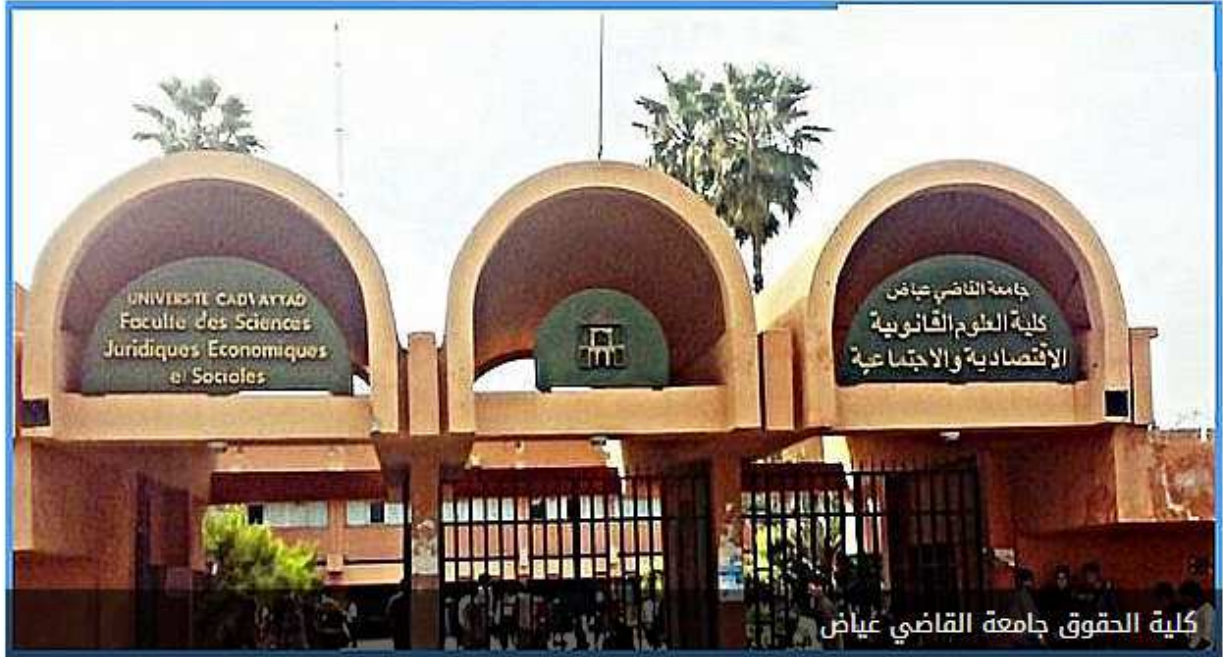
كلية الحقوق جامعة القاضي عياض

27 مارس 2018 ، آخر تحديث : الثلاثاء 27 مارس 2018 - 11:58 صباحًا